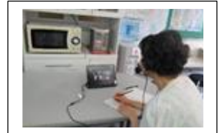
သင်ယူနေပုံ